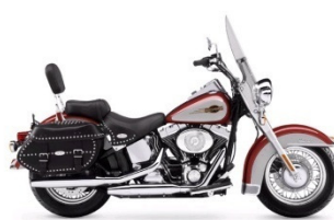
HERITAGE SOFTAIL CATEGORIE A