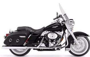
ROAD KING CATEGORIE A