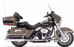
ELECTRA GLIDE CATEGORIE A