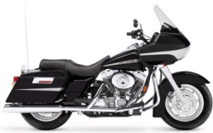
ROAD GLIDE CATEGORIE A