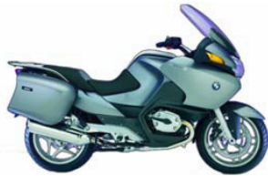
BMW R1200 RT CLASSE B