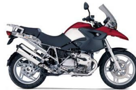
BMW R1200GS CLASSE B