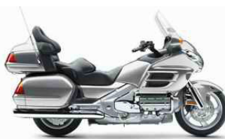
HONDA GOLD WING CLASSE B