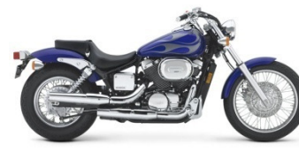
HONDA SHADOW 750 CLASSE C