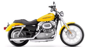
SPORTSTER 883 CLASSE C