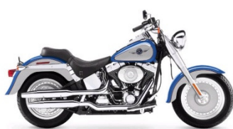
FAT BOY CLASSE A