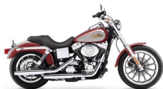
LOW RIDER CLASSE A