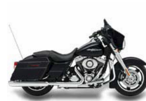
STREET GLIDE CLASSE A